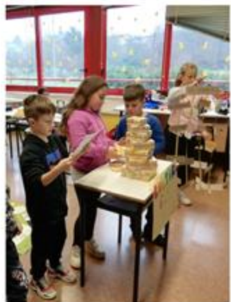
30 novembre 2023